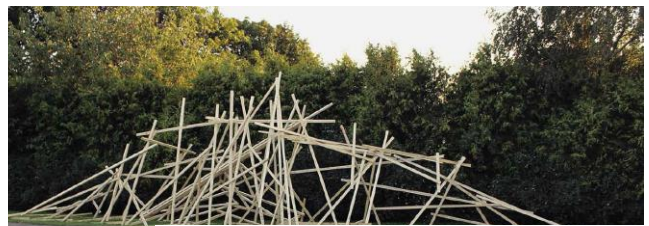
Natur skulptur i landsbyen Schelde